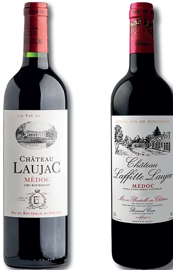
Fig. 8 : Bouteilles de Château Laujac et Laffitte Laujac © boutique.chateaulaujac.com.

mais les vaches paient le matériel viticole, et leur fumier fertilise nos sols calcaires. » À proximité de l'estuaire de la Gironde, au précieux effet tampon, le vignoble de Laujac, replanté à raison de trois hectares par an, est passé de 45 à 80 hectares, pour un âge moyen de vingt ans et dispose de deux terroirs : des argiles calcaires pour les merlots qui donnent au vin sa rondeur, des graves fines, drainantes, pour le cabernet sauvignon majoritaire et le petit verdot qui assurent la structure et la complexité. L'élevage en fûts de chêne français dure douze mois. Stéphane Courrèges conseille la propriété depuis le millésime 2014 (2013, le premier millésime du couple, fut, comme chacun s'en souvient, dantesque). Un chai à barriques a été réaménagé sous le château. « Nous voulons rester un médoc classique, puissant et complexe, avec des cabernets bien mûrs et des tanins fins ». [...] Quant à la distribution, si, historiquement, Laujac vendait tout à l'export, Suisse, Belgique, Canada, Japon, États-Unis, Chine, Allemagne, il est aussi désormais sur le marché français (15 %) et sur la