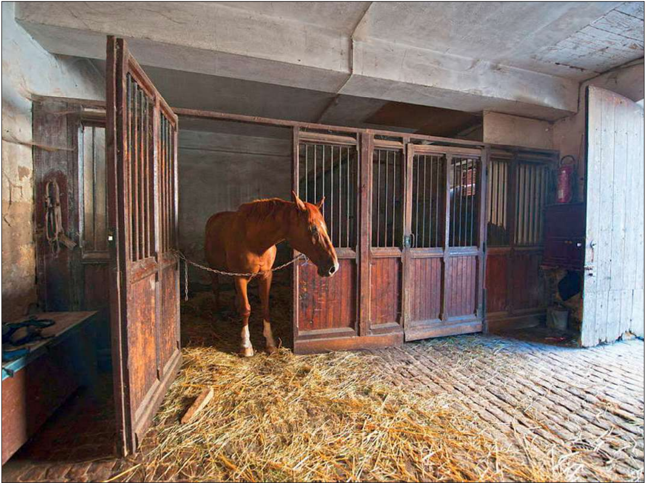
Fig. 6 : Ancienne grange abritant l'écurie du château

faut enfin accompagner le Syndicat des marais dans ses travaux d'aménagement des chenaux à travers les palus. Chaque domaine secrète banalement son petit « système productif local », comme on dit en économie des territoires et des organisations.