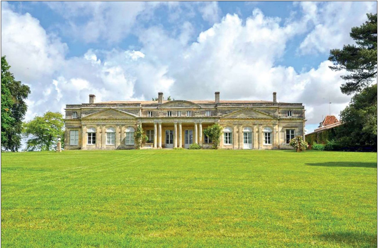
Fig. 2 : Vue du château Laujac

Cabarrus, le 6 avril 1829 pour une valeur estimée à 400 000 francs.