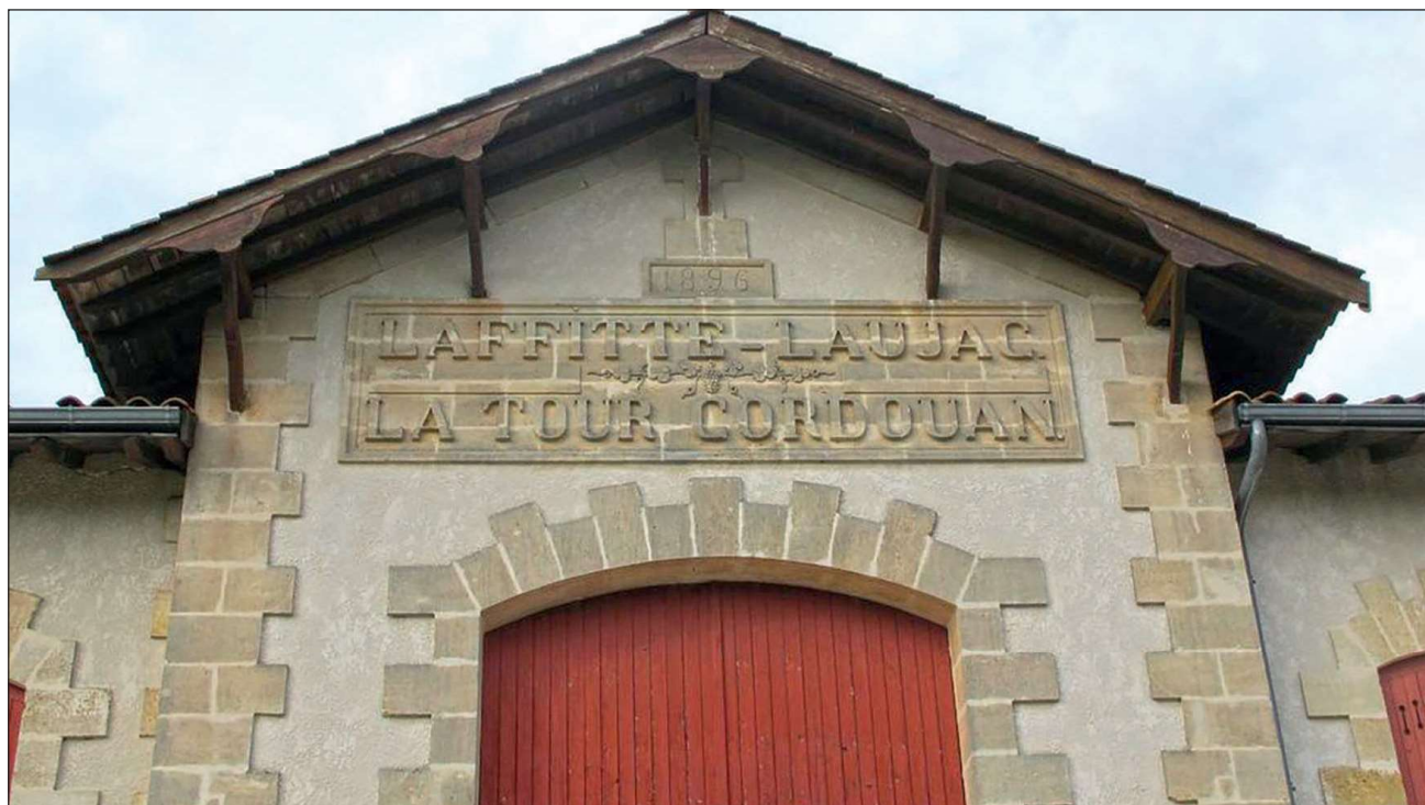
Fig. 7 : Pignon ouest du cuvier portant l'inscription : 1896/LAFFITTE-LAUJAC/LA TOUR CORDOUAN © Région Nouvelle-Aquitaine, Inventaire général du patrimoine culturel/Conseil départemental de la Gironde, C. Bordes.

Un ultime point de tension surgit lorsqu'une partie du vignoble est frappée par une grève des salariés quand se met en place le gouvernement de Front populaire en été 1936 et encore en juillet 1937, pendant une semaine 55 . Le régisseur doit déduire des journées de grève, mais ajouter des prestations sociales et des congés payés. Il faut désormais prendre en compte aussi de tels facteurs de gestion des employés dès lors que les Cruse sont considérés peu ou prou comme des « patrons » insérés dans un rapport de classes... et ce, alors même qu'ils avaient mise en œuvre des mesures « philanthropiques » depuis le début du siècle, comme une sorte de sur-salaire annuel pour aider à la couverture santé.