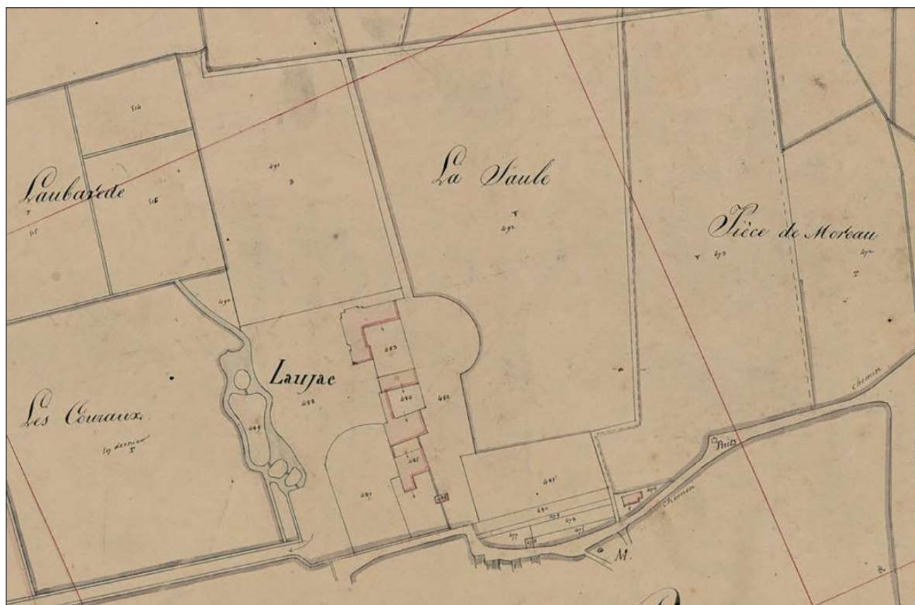
Fig. 1 : Extrait du plan cadastral, 1832 (AD Gironde).

de construction et de renouvellement du capital de qualité et de réputation de ses productions, au travers des aléas conjoncturels et naturels. C'est le « modèle » même de ce micro-système productif local qui mobilise l'attention de l'historien puis aussi de l'économiste de gestion : en effet, comment les Cruse ont-ils réussi peu ou prou successivement, d'abord à garder le contrôle de leur propriété de Laujac depuis un siècle trois quarts, à renouveler leur capital de savoir-faire viticole, à entretenir un modèle original car articulé autour d'une polyculture et enfin à renouveler à plusieurs reprises l'image de marque des vins produits dans ce Nord-Médoc ?