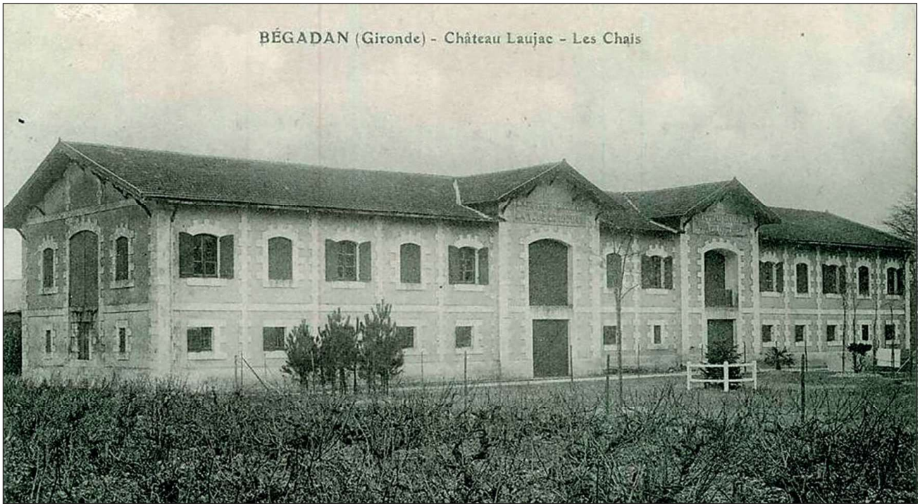
Fig. 4 : Cuviers de Laujac, carte postale.

La salle à manger se trouvait dans l'actuel fumoir ; cuisines et souillarde [l'arrière-cuisine] lui faisaient suite à l'emplacement de l'actuelle chambre d'amis et les communs se prolongeaient dans le bâtiment du cuvier qui s'appuyait sur le château. Le grand salon était partagé en deux pièces d'une égale grandeur. Quelle était l'affectation de l'actuelle salle à manger cuisine ? Sans doute des chambres ; en tous les cas, la cuisine actuelle a été la chambre de madame Skawinski avant son mariage 12 .