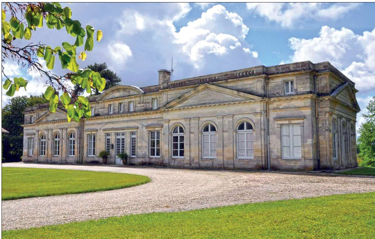
Fig. 3 : Château Laujac, façade nord

communes de Bégadan, Valeyrac et Civrac 9 . L'esprit d'entreprise d'Herman I Cruse, le fondateur de la société de négoce Cruse, devenue Cruse & fils frères en 1853, a été par conséquent récompensé par la constitution d'une fortune immobilière, vinicole et mobilière de grande taille : l'accumulation du capital a été substantielle, dans cette bourgeoisie du vin comme dans celle de l'industrie des régions textiles ou charbonnières, ou dans la Haute Banque 10 , par exemple.