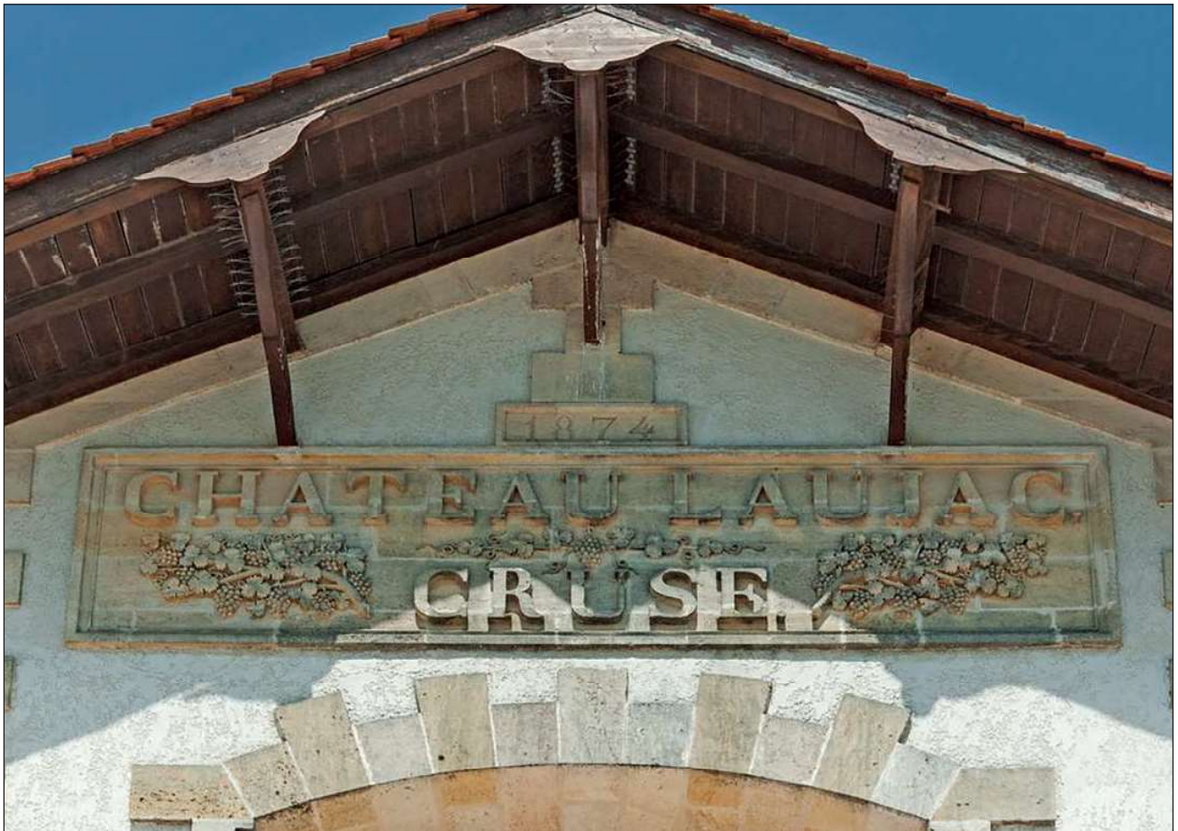
Fig. 5: Pignon est du cuvier portant l'inscription : 1874/CHATEAU LAUJAC/CRUSE

desserte routière, gestion du personnel et des prestataires de services, etc. Formé à l'Institution royale agronomique de Grignon, Pierre Skawinski (1812-1902) devient alors une figure du monde viticole 20 : en effet, il est le régisseur de plusieurs grands domaines, tel Château Giscours depuis 1847 ; et il forme ses trois fils au métier.